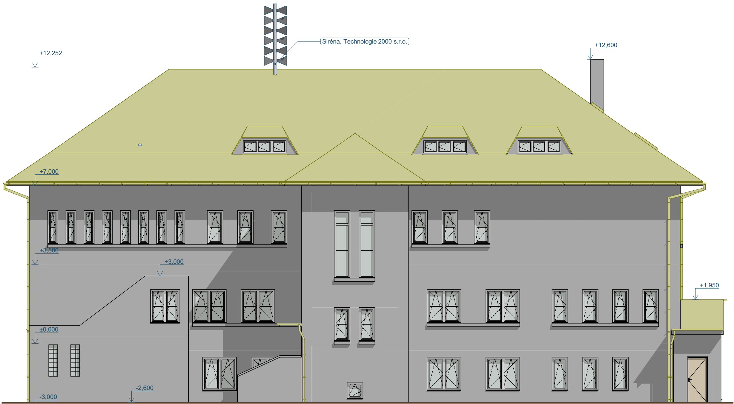
S Severní pohled 1:100