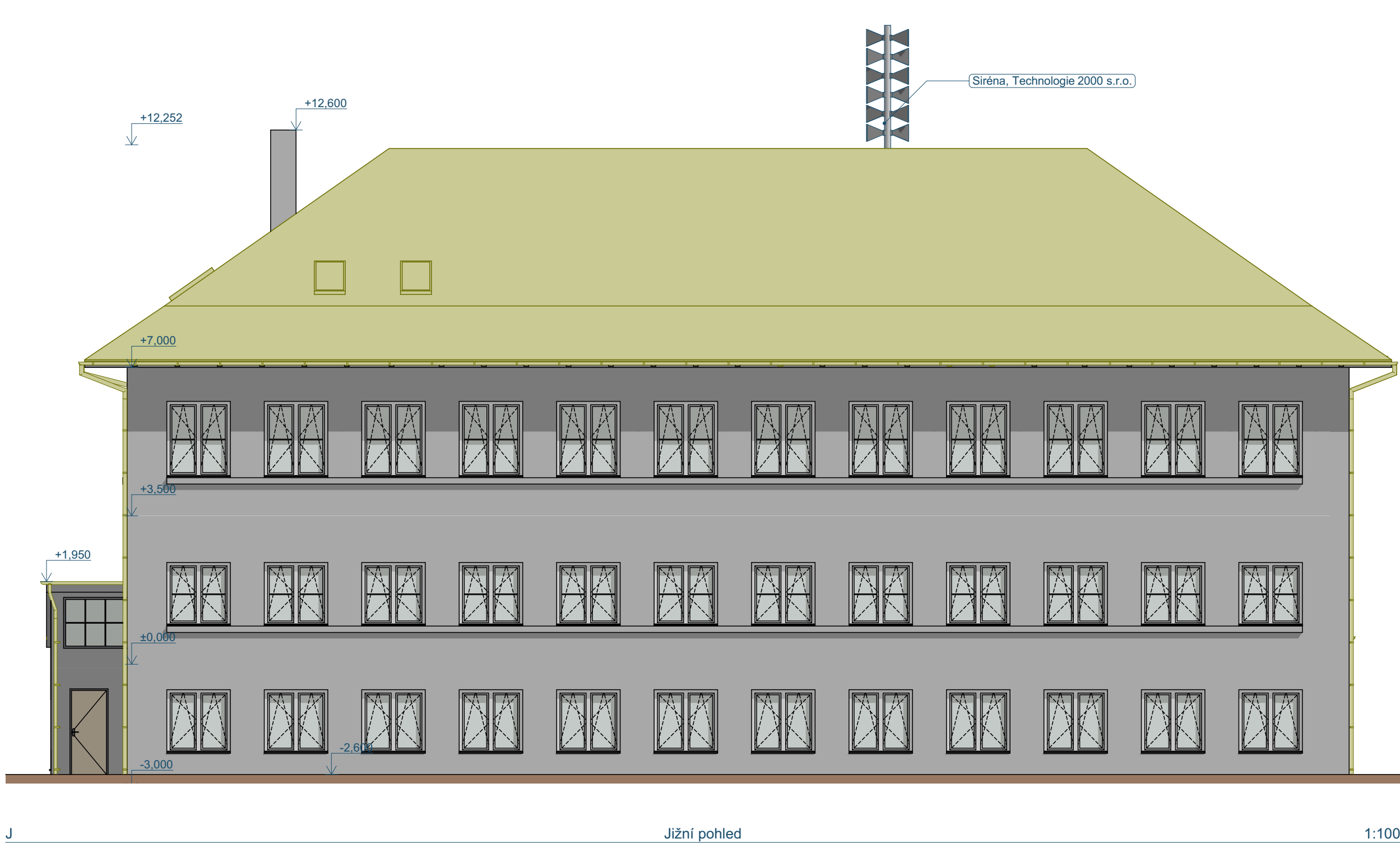
J Jižní pohled 1:100